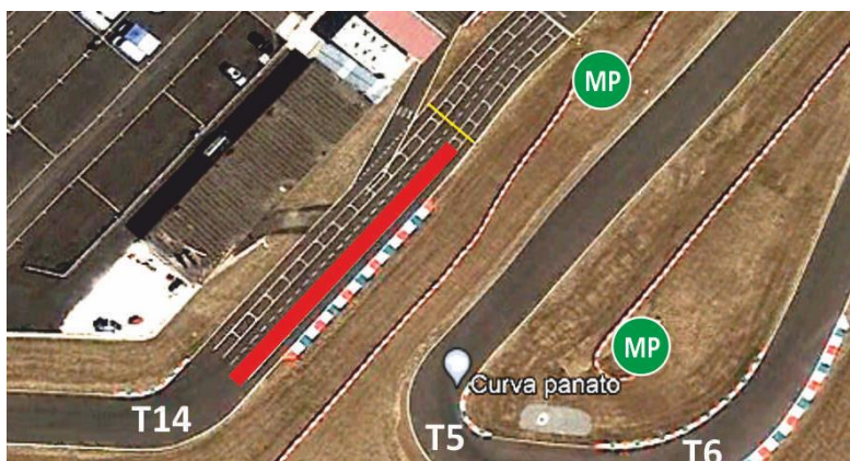
Anhalte- und Wartezone bei ROTER FLAGGE:

Parc Fermé regulations apply. Further instructions will follow by Officials.